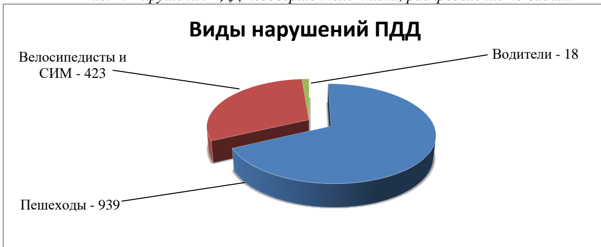
Рис. 2. Нарушения ПДД несовершеннолетними, распределение по видам.

Анализируя возрастные характеристики несовершеннолетних, нарушивших ПДД, можно сделать вывод, что к группе риска относятся дети 10-13 лет, которые характеризуются стойкими проявлениями «переходного возраста», психофизиологическими изменениями личности и импульсивностью поведения (рис. 3).