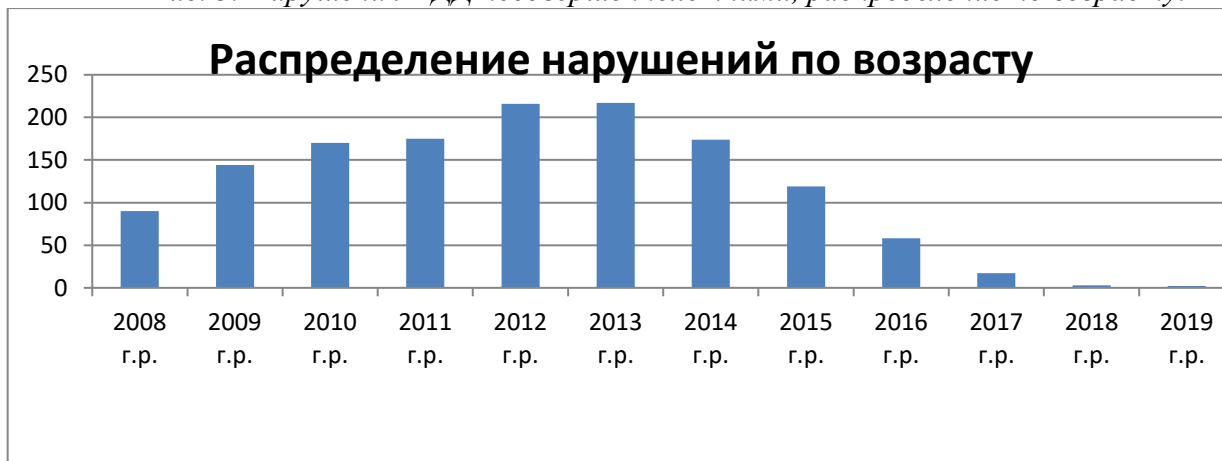
Рис. 3. Нарушения ПДД несовершеннолетними, распределение по возрасту.

Сделав выборку по образовательным учреждениям, было выявлено, что учащиеся следующих красноярских учебных заведений, а именно: